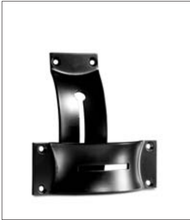
Audience wall mount bracket / Wandhalterung