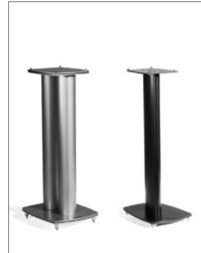
Stand 4 (silver), Stand 1 (black)

Most often a subwoofer will be utilized for the LFE-signal in such setups, especially in larger listening rooms. The position of the subwoofer will be dependent upon the size of the room and its acoustics. Dynaudio recommends placing the subwoofer close to the front speakers, but not too close to any walls, corners or furniture. This helps make it easier to sonically integrate the subwoofer in the existing surround channel setup.