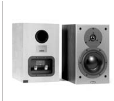
Audience 52 SE

Derartige Beschädigungen werden nicht durch die Garantieleistung abgedeckt und sollten daher durch vorherige Beratung mit Ihrem Dynaudio Fachhändler vermieden werden.