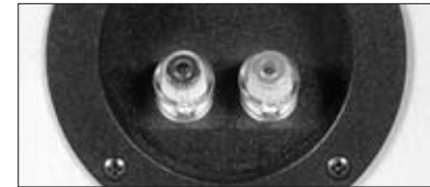
Loudspeaker binding posts / Lautsprecheranschlüsse

In a surround set-up, center, side or rear loudspeakers as well as a subwoofer can be connected to provide for a multi-channel listening experience. Please refer to the amplifier's owner manual for particular connection instructions.