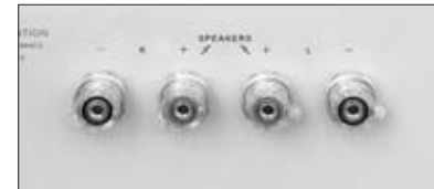
Power amp outputs / Verstärkeranschlüsse

Dynaudio loudspeakers feature a carefully fine-tuned frequency crossover, using selected parts and an advanced circuitry to achieve a truly balanced and smooth frequency response. Therefore, dividing the frequency sections through bi-wiring or bi-amping is neither beneficial nor optional.