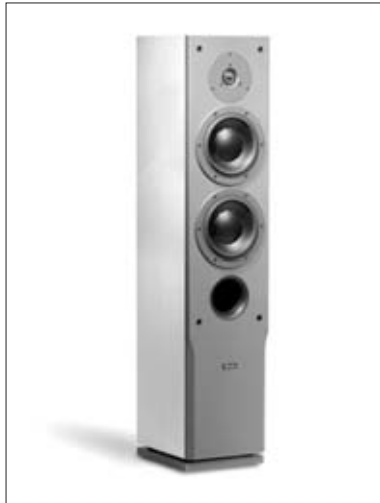
Audience 72 SE

This positioning will typically improve imaging and is especially recommended by Dynaudio.